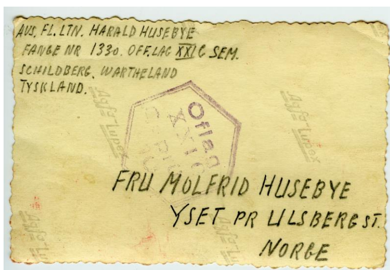
Gruppebilde fra Schildberg. Fange nr 1330 Harald Husebye i bakre rekke nr 2 fra høyre